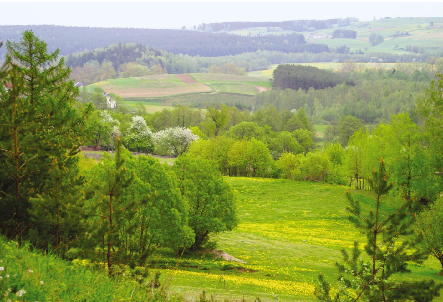
24. Smalnykų naršyklėje / Przeglądarka w Smolnikach / The browser in Smalnykai