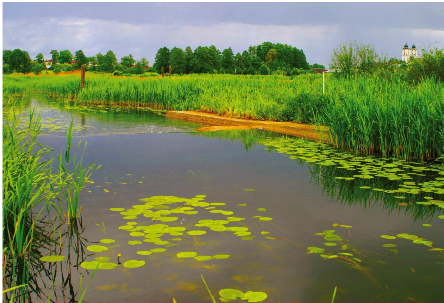
21. Seinai Seinos lopšy / Sejny w objęciach Marychy / Seina in Seina's arms