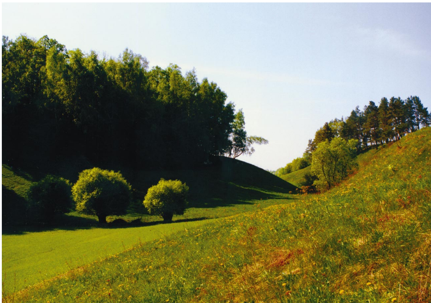
11. Piliakalnio papėdėje. Eglinė / U podnóža góry zamkowej. Jegliniec / At the foot of a castle hill. Eglinė