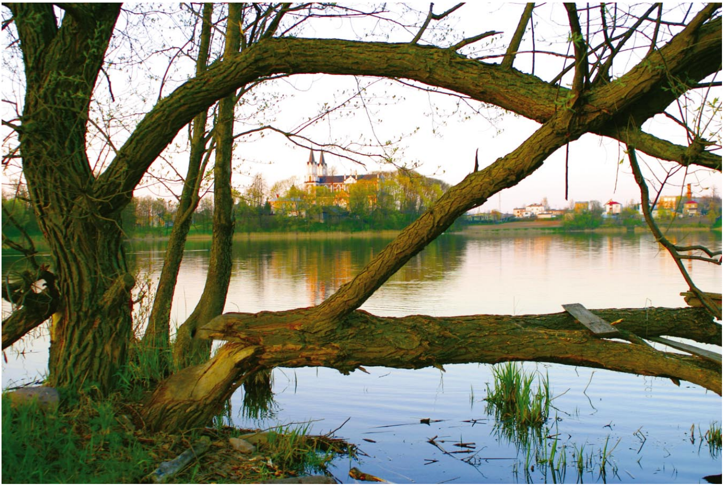
2. Prisikėlimo kvapas. Punios ež. / Woń zmartwychwstania. Jez. Punia / The Resurrection's fragrance. Punia lake