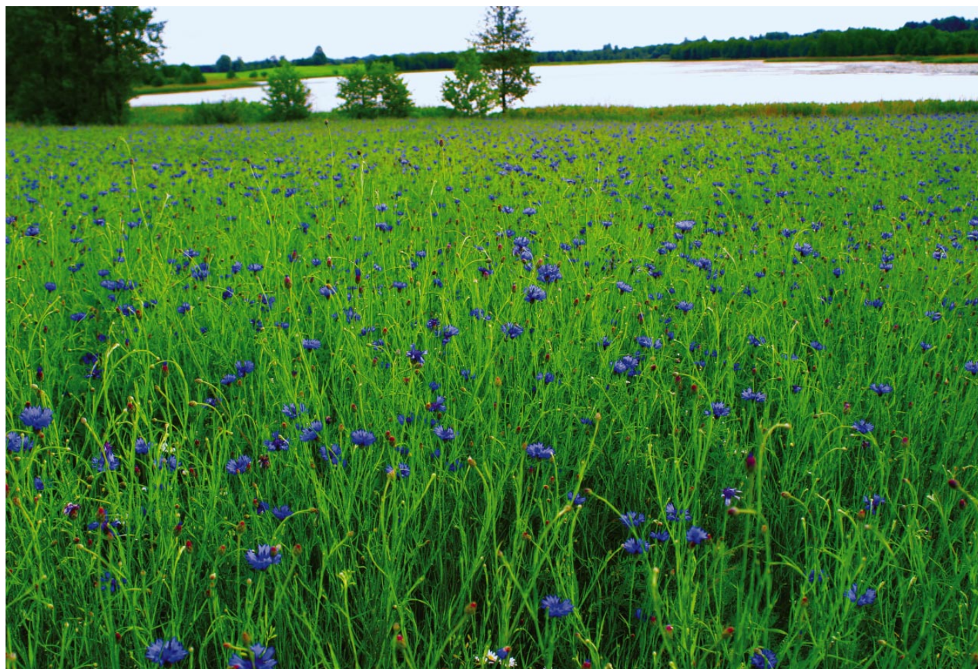
22. Seino ežero rugiagėlės / Chabry jeziora Sejny / Seinas lake's cornflowers