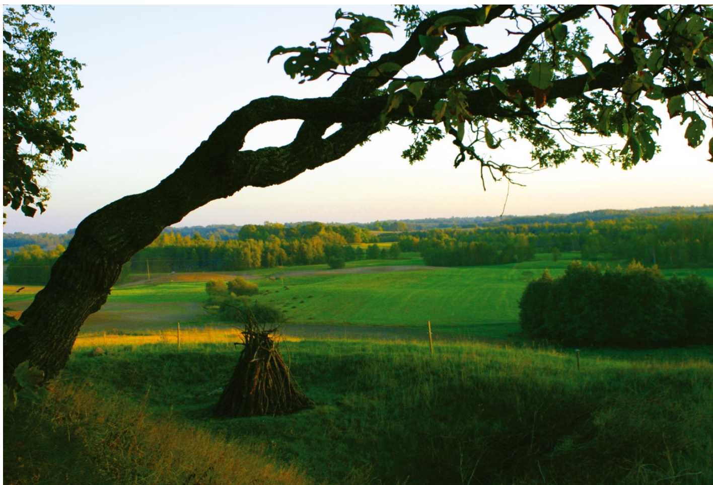
10. Jotvingių piliakalnyje. Eglinė / Na górze zamkowej. Jegliniec / On the castle hill. Eglinė