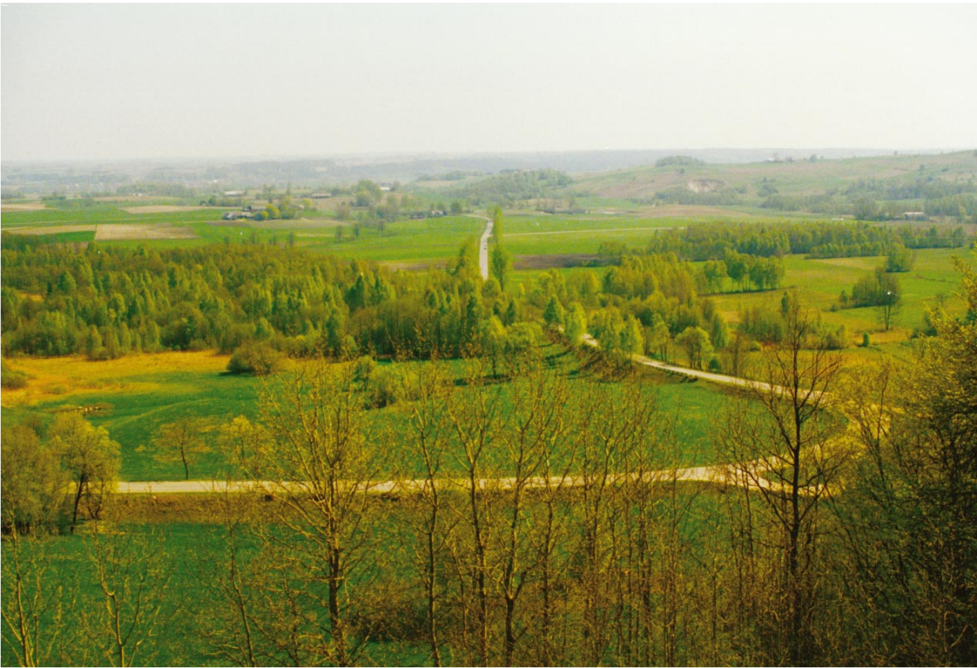
23. Aukščiausiojo keliu. Nuo Ravelių kalno / Droga Najwyższego. Z Rowelskiej Góry / On the God's road. From the Raveliai Hill