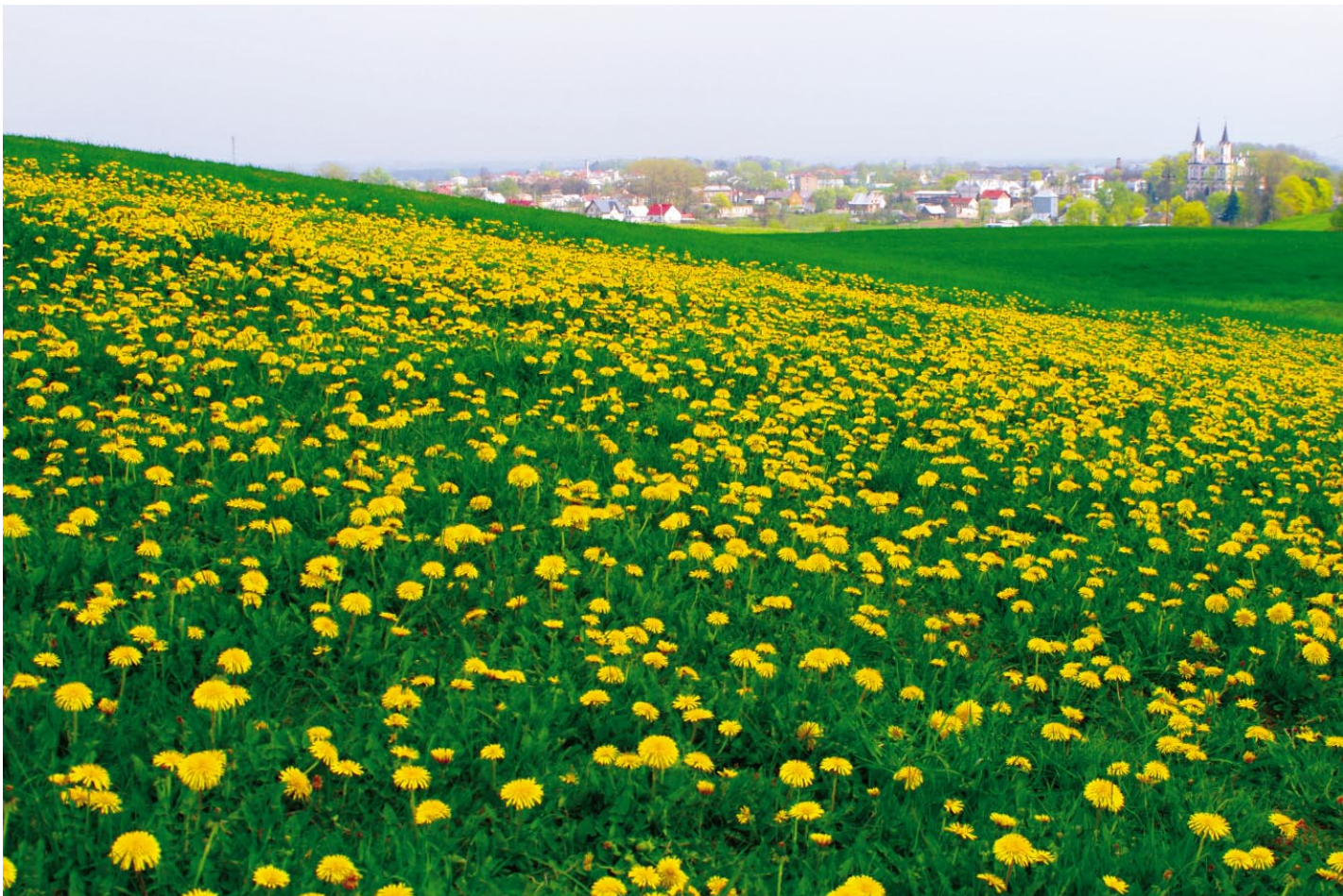
3. Iš ciklo Asmeniški pavasariai. Punksas / Z cyklu Prywatne wiosny. Puńsk / From the series: The private springs. Punksas