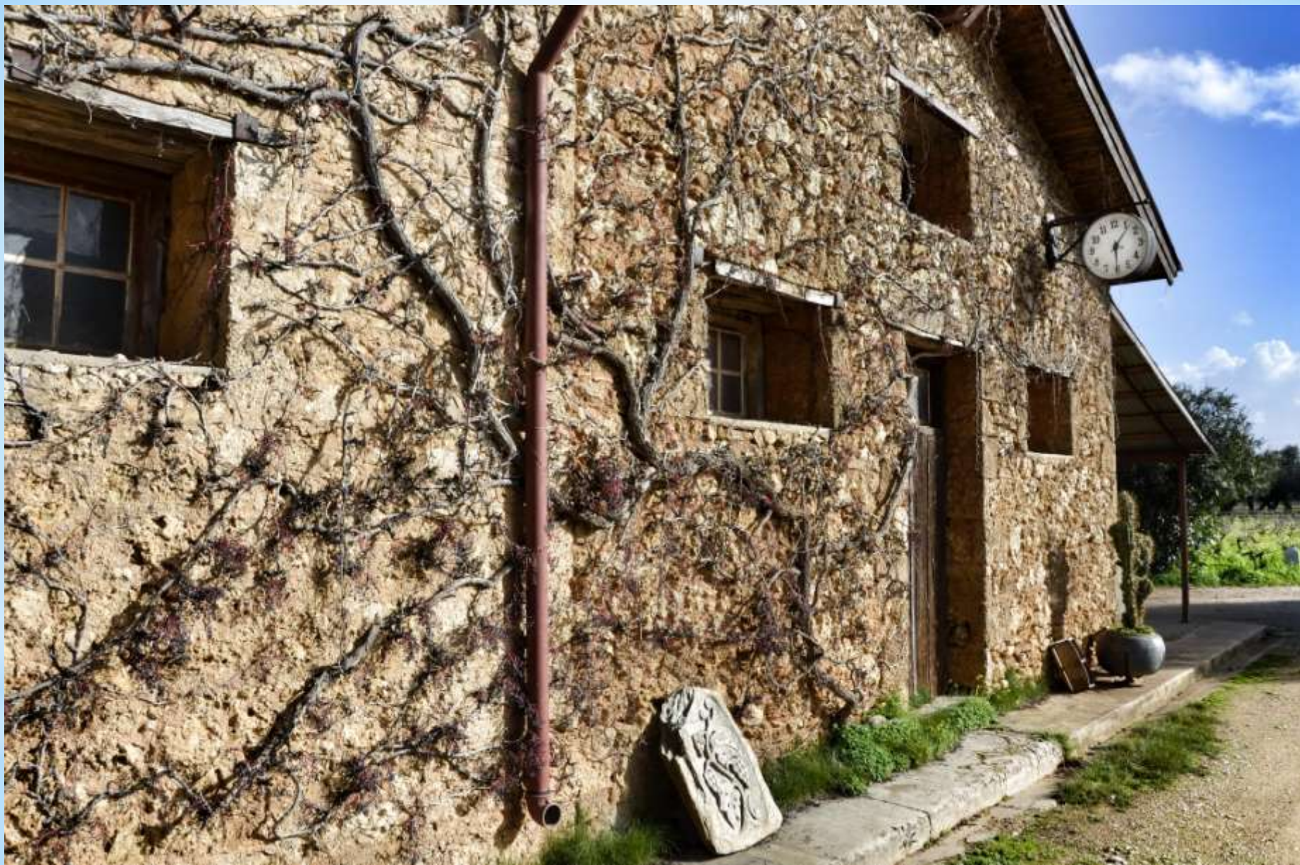
Merkouri vyninė bei muziejus.