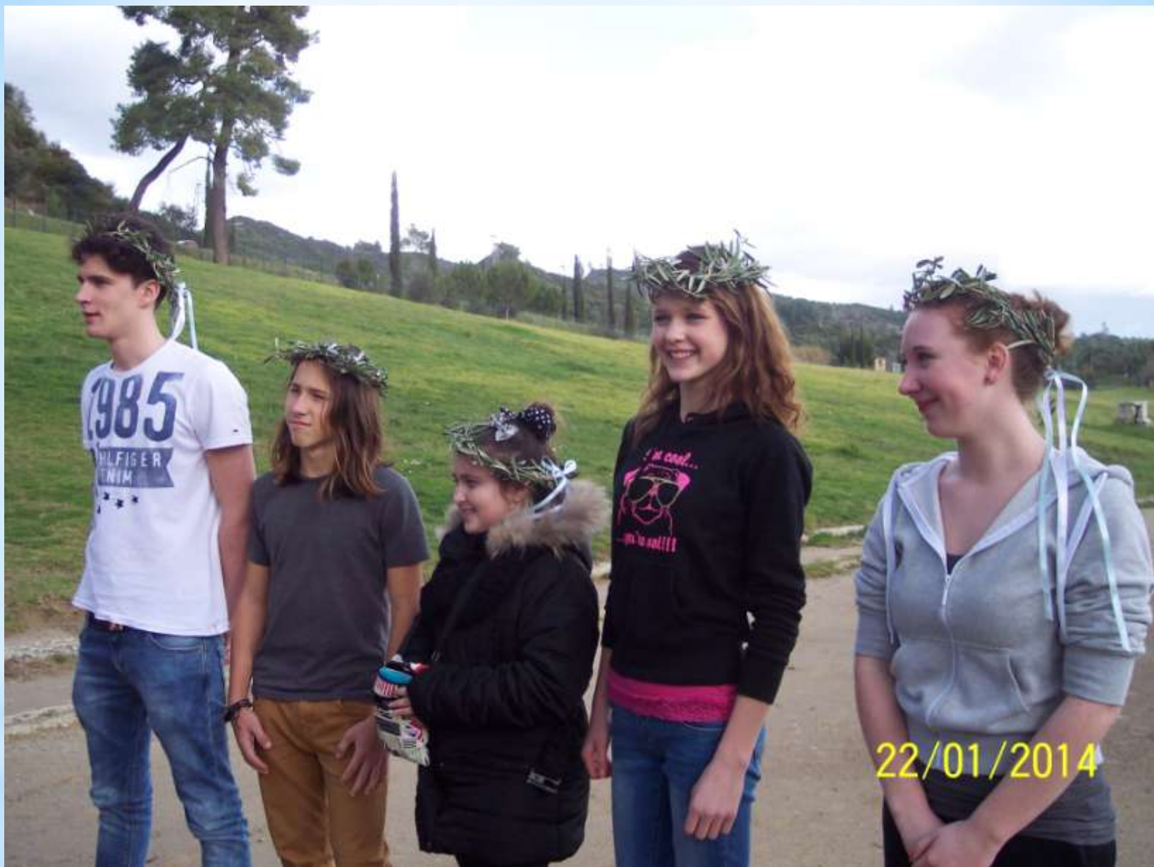
* Pirmųjų olimpičių žaidynių vieta. Mokiniai rungėsi bėgime. Nugalėtojai buvo apdovanoti alyvmedžių vainikais. Nuotraukoje mokiniai iš Kroatijos, Graikijos, Prancūzijos, Lenkijos, Vokietijos.