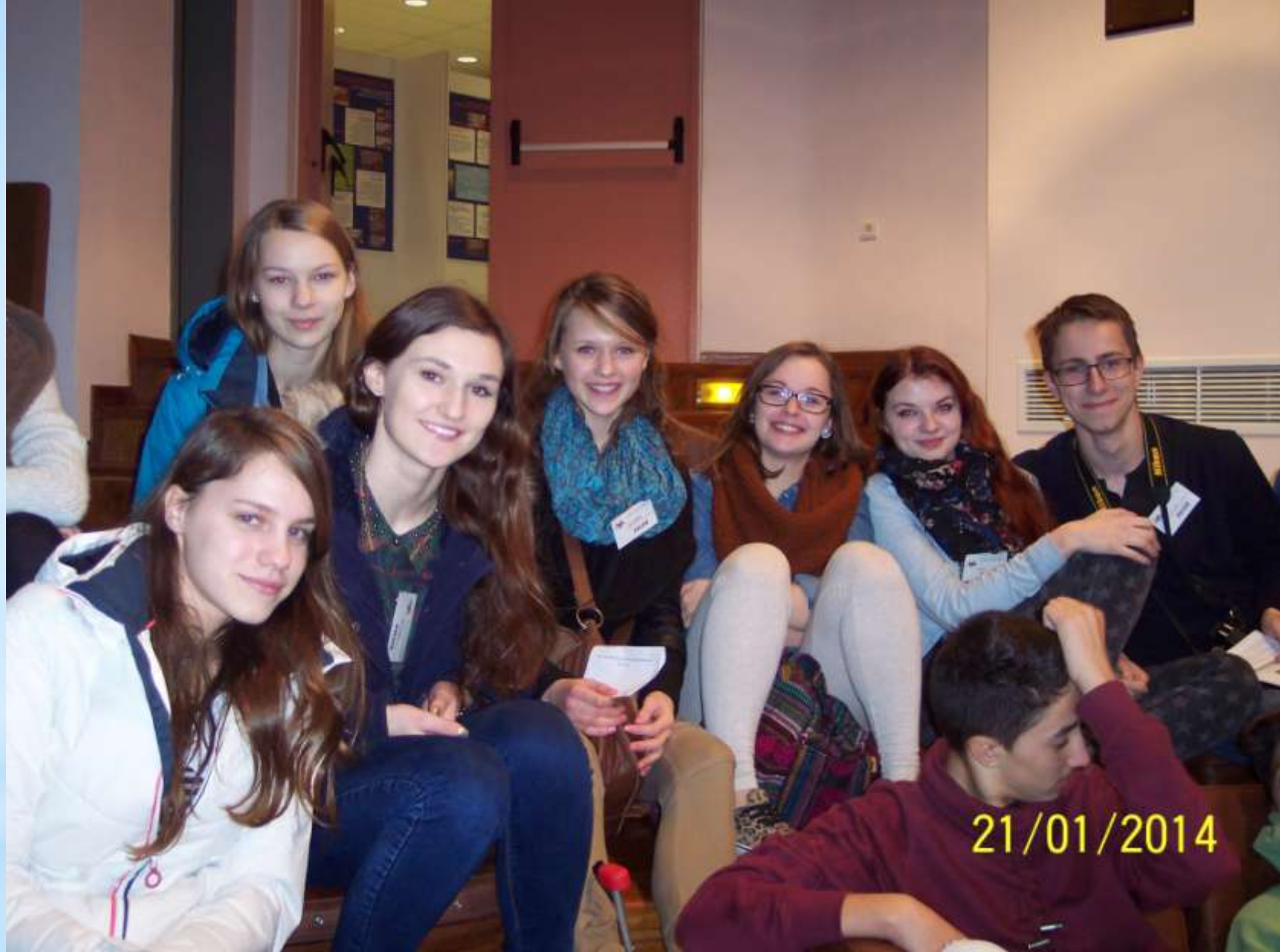
Moksleiviai klausosi paskaitos apie atsinaujinančius energijos šaltinius Patrų mokslo muziejuje.