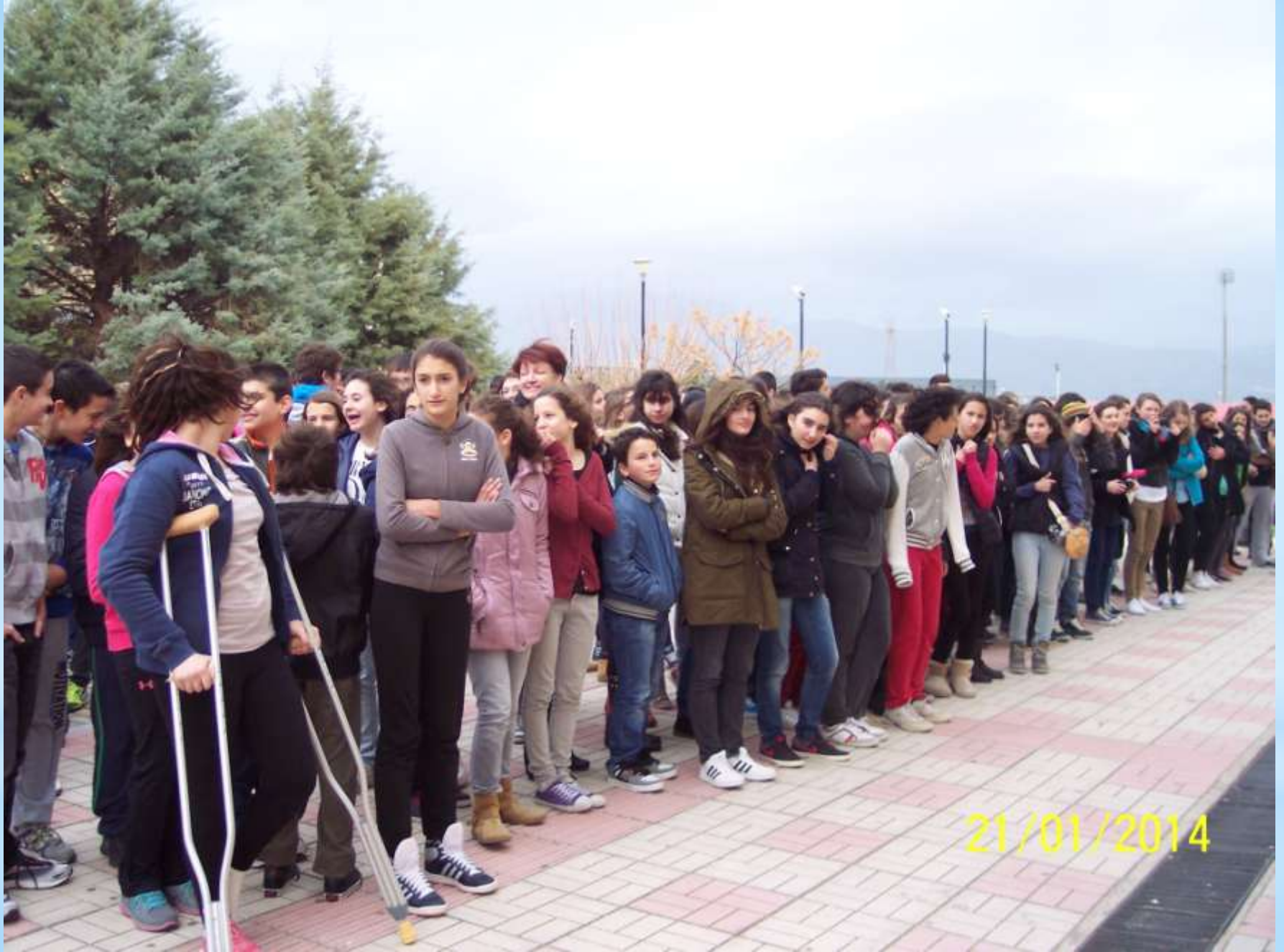
Gimnazijos mokiniai bei atvykę svečiai.