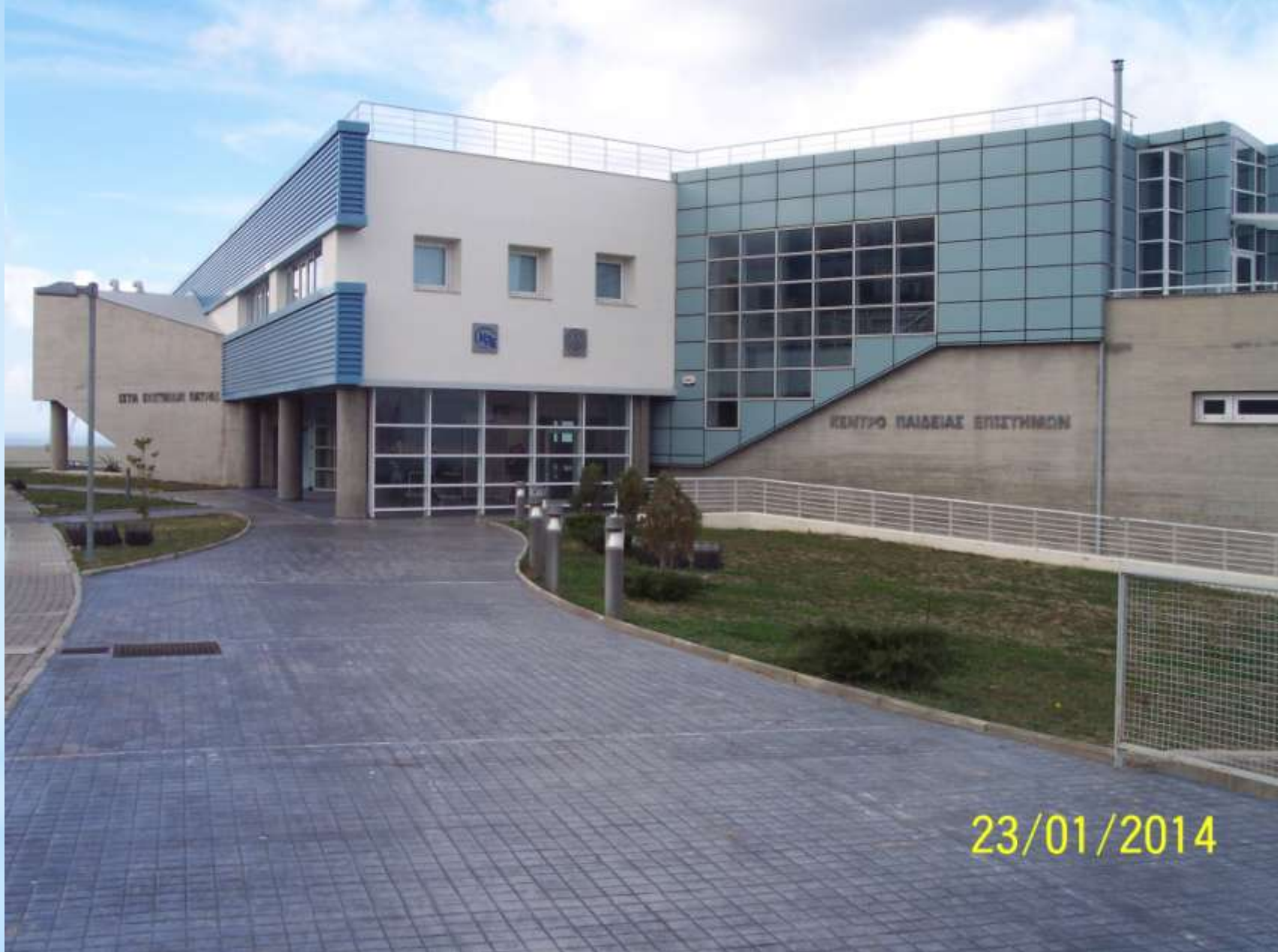
Mokslo ir švietimo centras Patruose.