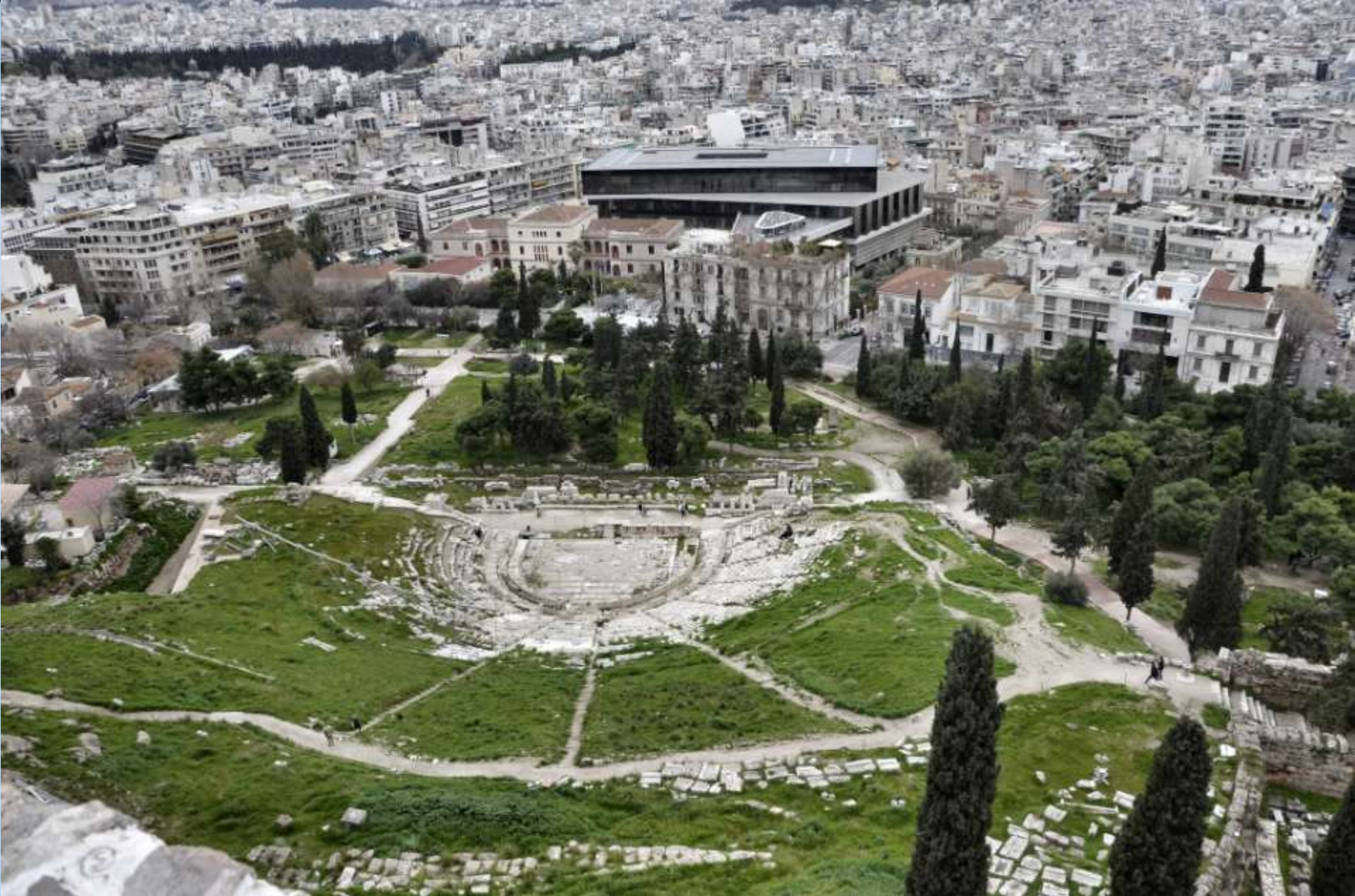
Kalno papėdėje - Dioniso teatro griuvėsiai.