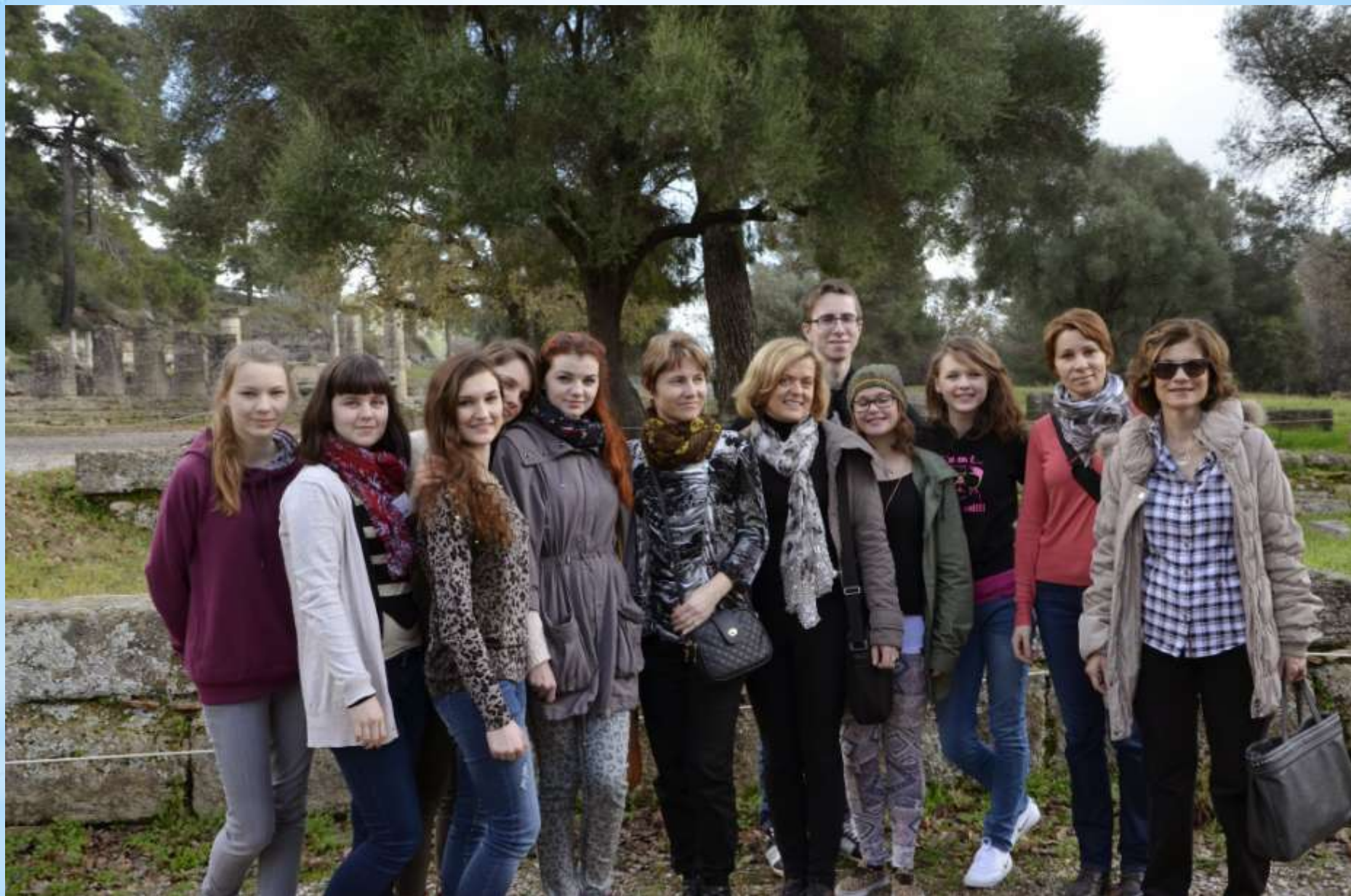
Punskiečiai Olimpijoje su Patrų Kastritsiou gimnazijos projekto koordinatore.