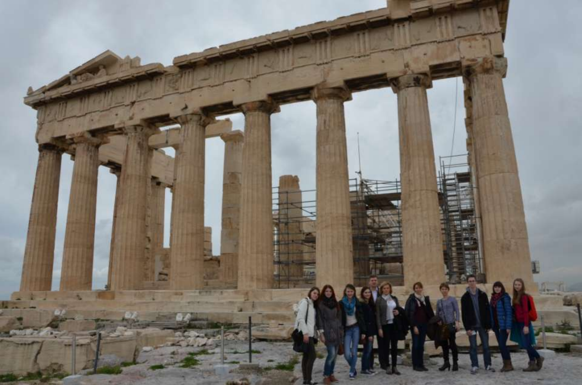
Partenonas - šventykla Akropolyje miesto deivei Atėnei, pastatyta V a. pr. m. e.