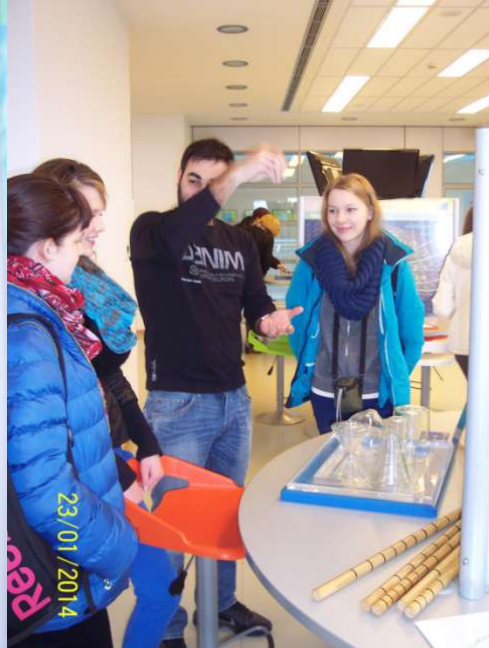
Praktiniai užsiėmimai Mokslo ir švietimo centre. Mokiniai patys turėjo surasti pateiktos užduoties sprendimą.