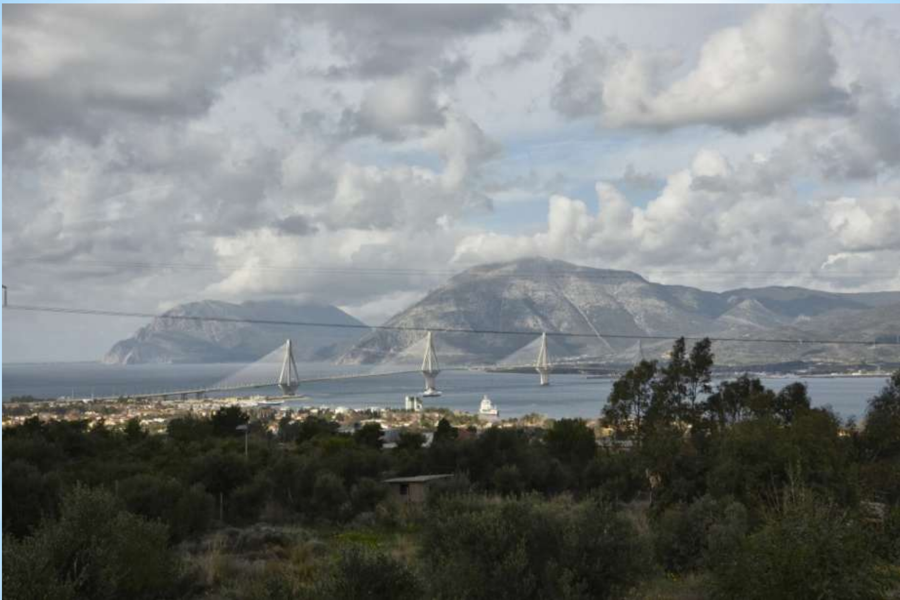
Rio-Antirio tiltas, jungiantis žemyną su Peloponeso pusiasaliu.