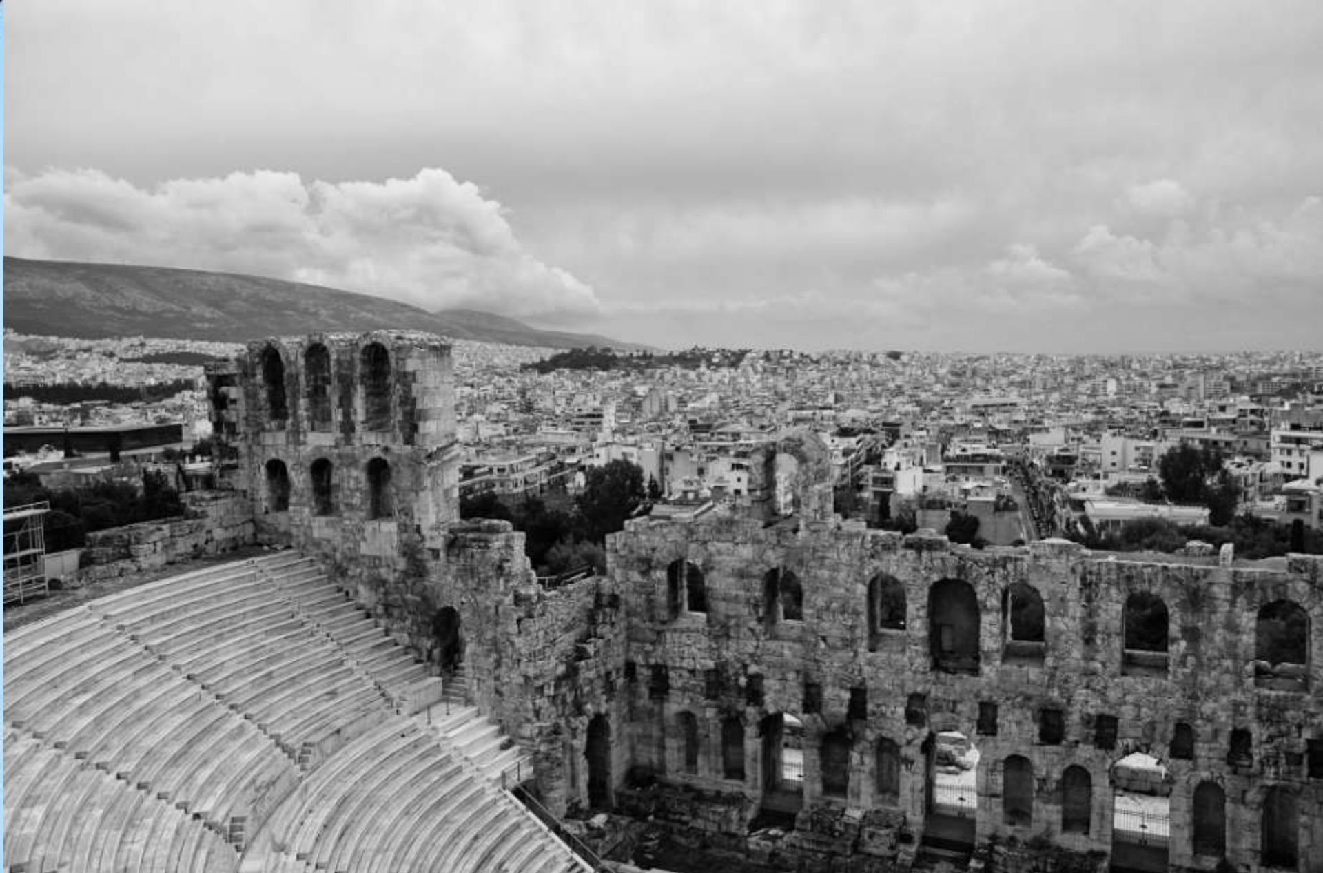
Herodoto teatro griuvėsiai. Antikos laikais čia buvo statomi Sofoklio, Euripido ir kitų dramaturgų veikalai.