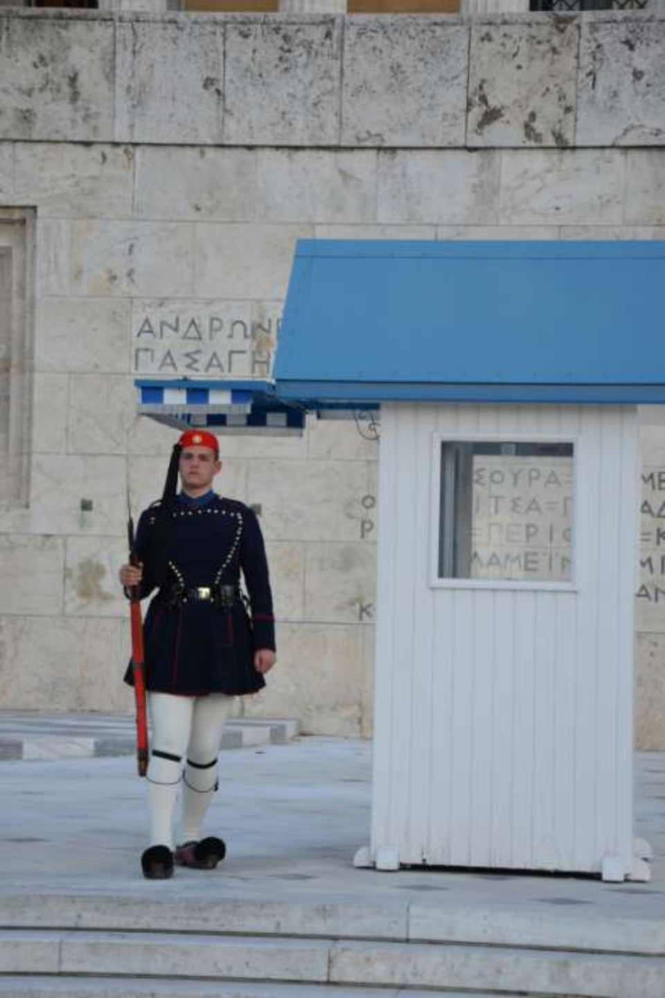
Prie Parlamento Atenuose.